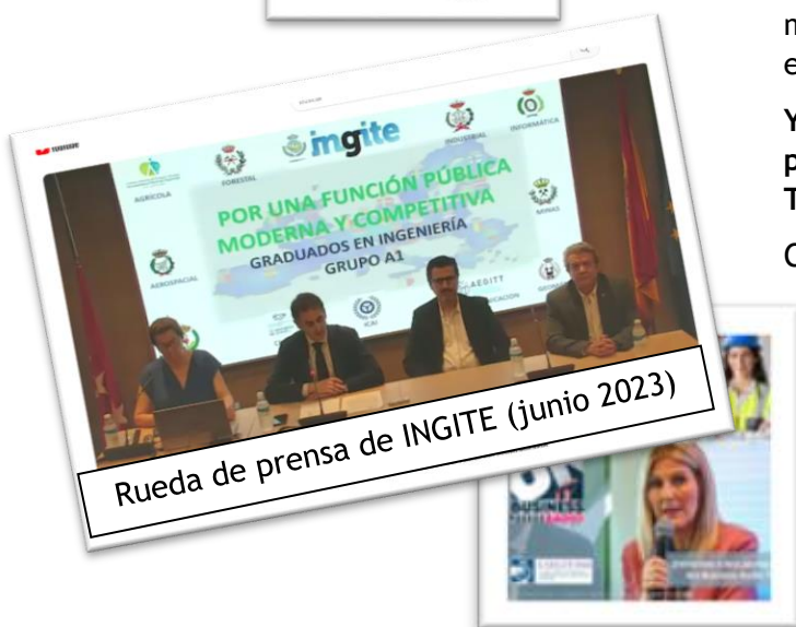
Rueda de prensa de INGITE (junio 2023)

¡Continuaremos en el 2024 impulsando la comunicación!